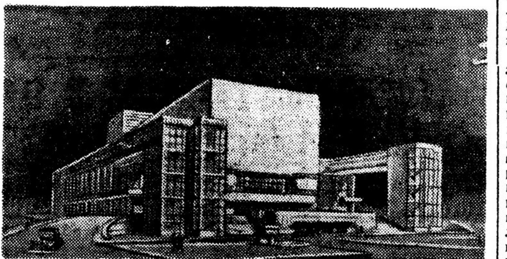
Проект театра в Ростове (Архитектор ШУКОВ).

Если проследить историю образования стилией, то легко увидеть, с какой постепенностью зарождалась и развивалась новая художественные формы, которые с течением времени обрываются в новый, не существовавший ранее художественный стиль. История искусств показывает, как постепенно отмирают одни за другим