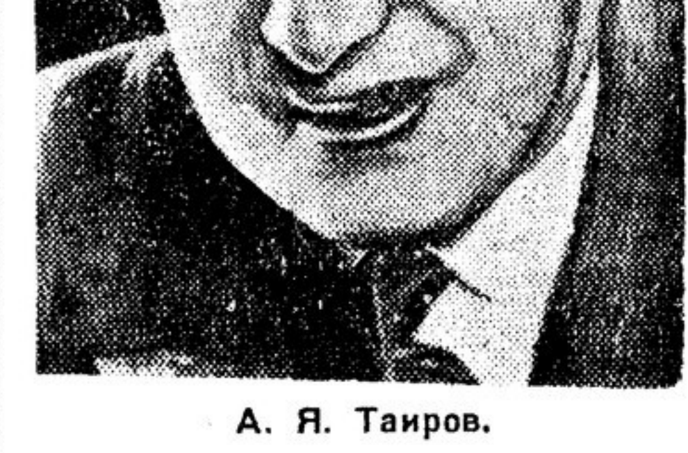
А. Я. Тайров.

Как живо прозвучали после этого призывы к более глубокому изучению искусства, не нужно ли спастись европейской театральной постановкой, посредством техники постановки, посредством